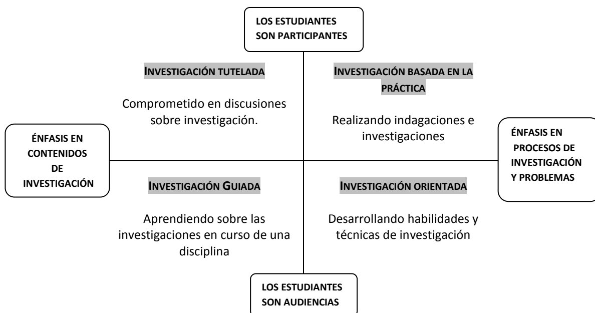
Figura 1. Tipos de ABI. Adaptación al castellano de Peñaherrera et al. (2014) de Healey y Jenkins (2009)

En la figura 1, tomada de Peñaherrera et al. (2014) se refleja el papel más o menos activo de los estudiantes en función de la estrategia seguida y de si el énfasis está en los contenidos o en el proceso de investigación.